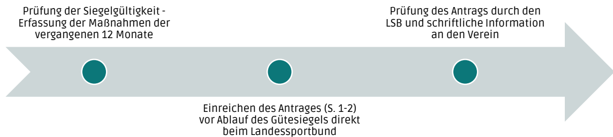
Abbildung 2: Ablauf der Beantragung zur Verlängerung des Gütesiegels Familienfreundlicher Sportverein

Mit der Verlängerung verbunden, ist ein Gutschein über 50 Euro für Bildungsmaßnahmen des Landessportbundes oder der Kreis-/Stadtsportbünde.